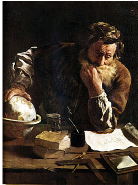
Figura 2: A gull

Grande parte do trabalho de Arquimedes em engenharia surgiu para satisfazer as necessidades de sua cidade natal, Siracusa. O escritor grego Ateneu de Náucratis descreveu como o Rei Hierão II encarregou Arquimedes de projetar um grande barco, o Siracusia, que poderia ser utilizado para viagens de luxo, transporte de suprimentos, e como um navio de guerra. É dito que o Siracusia foi o maior barco construído na Antiguidade Clássica.[20] De acordo com Ateneu, ele era capaz de carregar 600 pessoas e nele havia jardins decorativos, um gymnasion e um templo dedicado à deusa Afrodite, dentre outras instalações. Uma vez que um navio desse tamanho deixaria passar uma